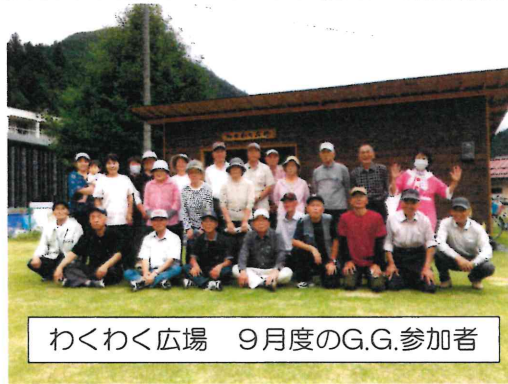
わくわく広場 9月度のG.G.参加者

西谷わくわく広場にて秋季グラウンドゴルフ大会を開催いたします。体を動かしてコロナに負けない健康な心と体を作りましょう。皆さまお誘いあわせのうえ、ぜひご参加ください。